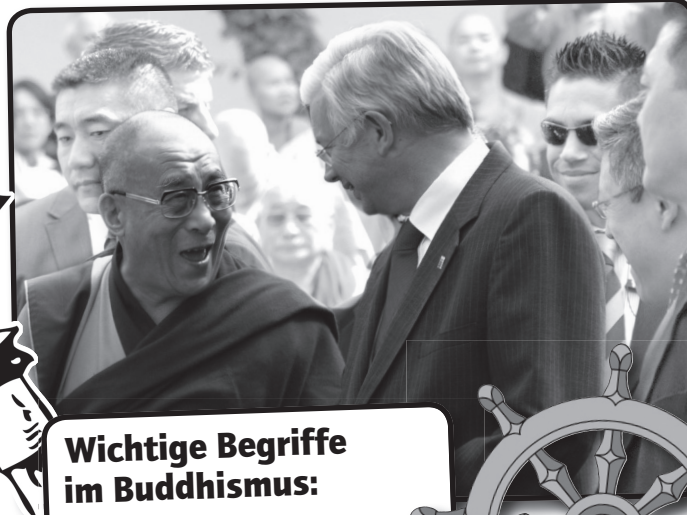
Der Dalai Lama (li.) 2009 in Deutschland mit Roland Koch.